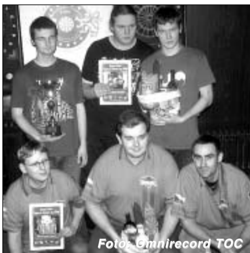
Týmy na třetích místech nahoře Stará Garda Malšajda HK, dole Baník Žacléř.